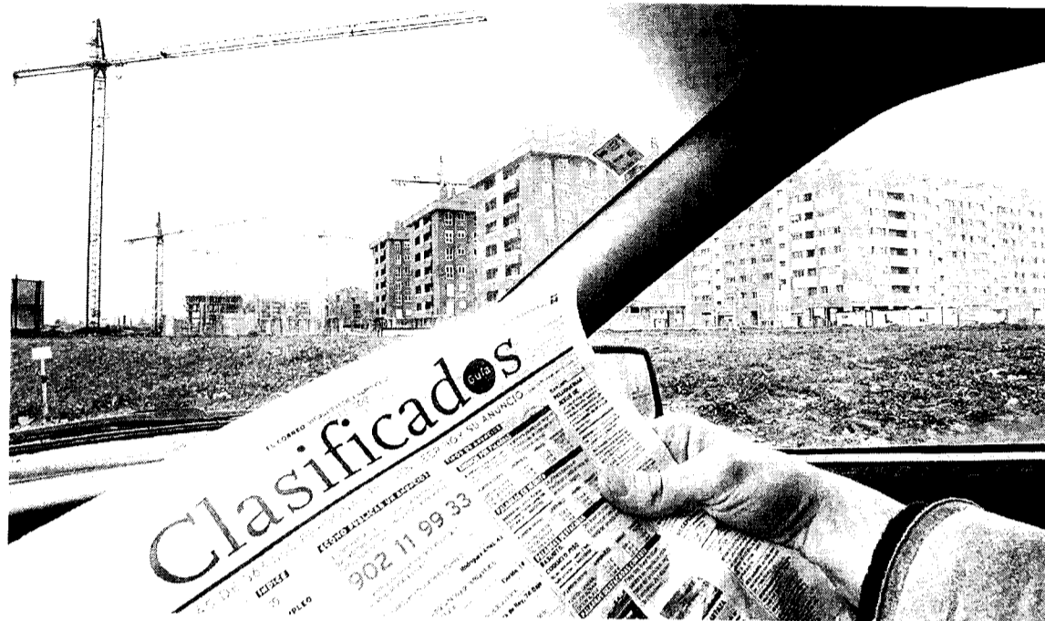
Un comprador repasa las páginas de anuncios clasificados en busca de un piso.

La posición de su grupo se reflejó con más concreción al debatirse las enmiendas a la totalidad, que han sido presentadas por el PP y EHAK. Al PNV no le convence la forma en que Madrazo y el PSE han repartido el suelo ur-