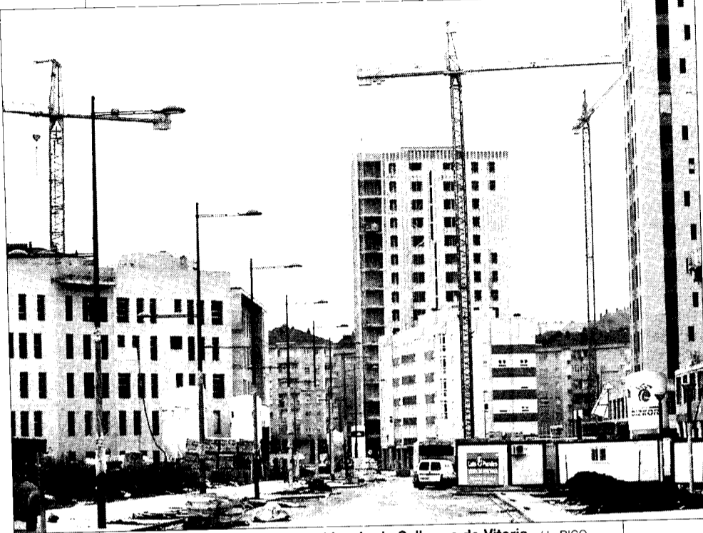
Edificios en construcción en el barrio de Salburua de Vitoria.

Defiende el autor que las medidas introducidas en el proyecto de ley del Suelo son adecuadas para agilizar la construcción de viviendas.