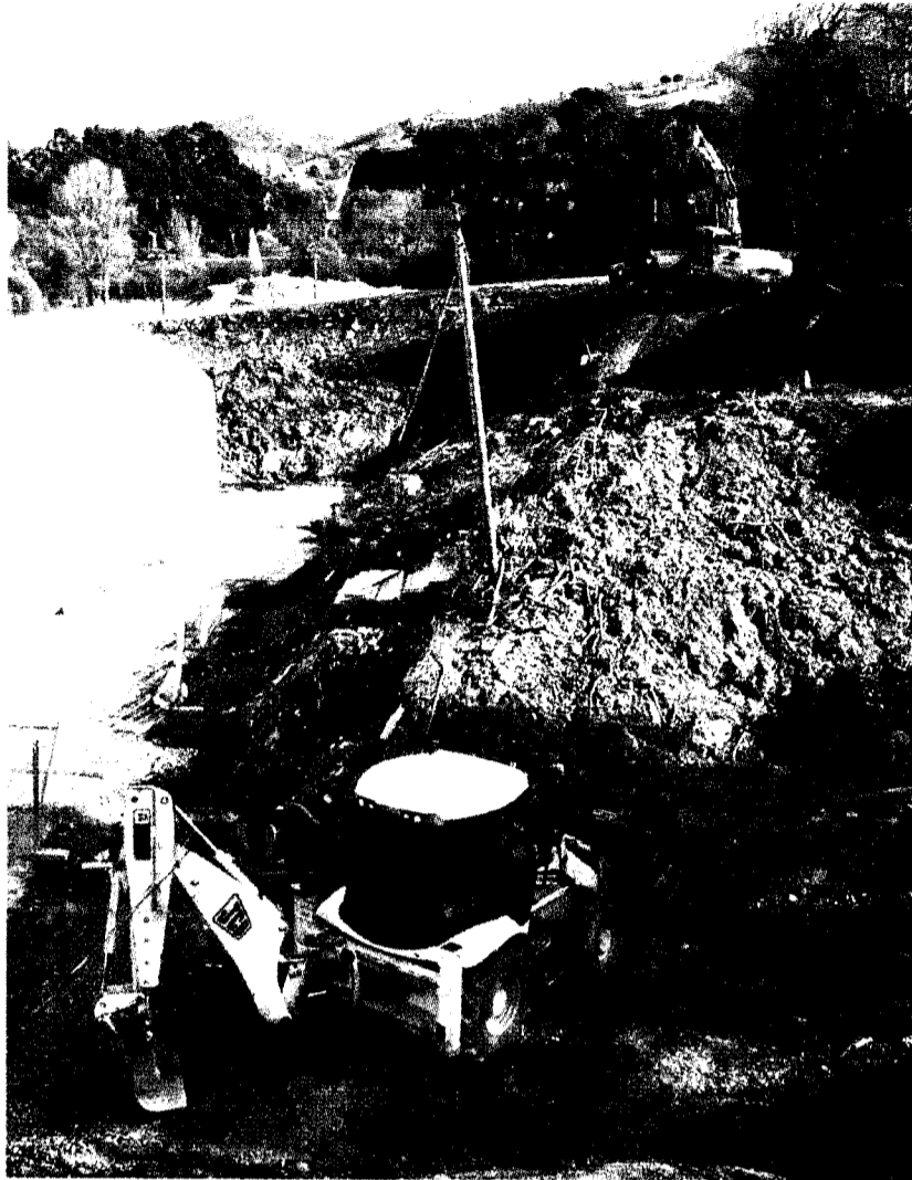
Los criterios medioambientales son importantes en la administración de obra pública.

La Comisión Europea analiza las diferentes fases del procedimiento de adjudicación, estudiando en cada