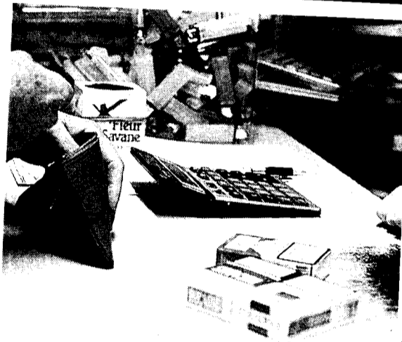
La CE prohíbe a fijar precios mínimos al tabaco.

«Apoyo el impulso de políticas sanitarias, pero tienen que respetar el derecho comunitario. Fijar precios mínimos para la venta de cigarrillos es contraria al derecho comunitario y beneficia principalmente a los fabricantes», declaró el comisario de Fiscalidad, Laszlo Kovacs.