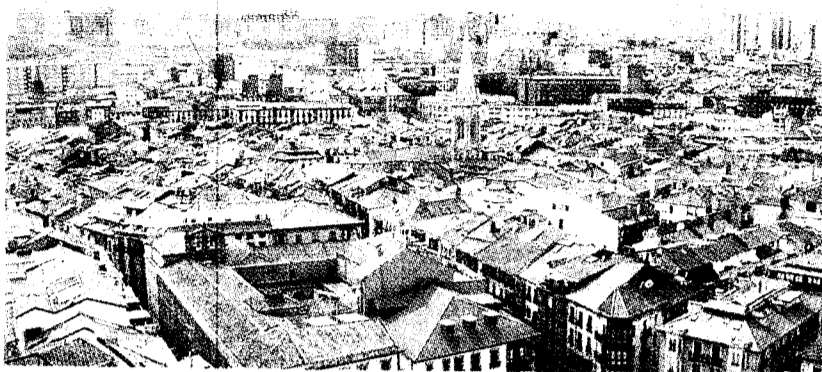
El Gran Bilbao fue una de las comarcas que menos aumentó su cifra de pisos.

Los mayores crecimientos se registraron en las comarcas alavesas de Estribaciones del Gorbea (32,8%) y Valles Alaveses (17,1%), en las guipuzcoanas de Urola Costa (29,9%) y Bajo Bidasoa (22,5%) y en las zonas vizcainas de Plentzia-Mungia (20,6%) y Duranguesado (16,2%). Por el contrario, el Gran Bilbao fue una de las comarcas que menos aumentó su cifra de viviendas, con un 8% en 10 años. La vivienda media vasca tiene una antigüedad de 35,3 años y posee 85,8 metros cuadrados de superficie útil, según el informe.