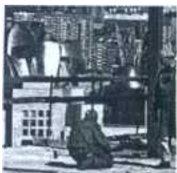
Unos obreros, en Abandoibarra

En Euskadi, en 2003 se registró un crecimiento acumulado del 4,2 respecto de 2002 en el valor de producción. Además del incremento