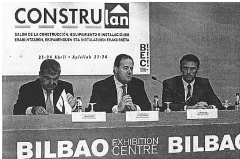
Los responsables del BEC presentaron ayer los dos nuevos certámenes que comienzan a partir de hoy en Barakaldo.