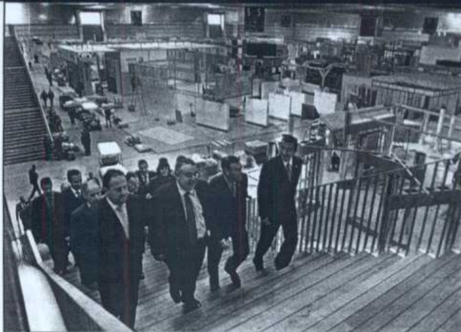
Momento del recorrido inaugural de BEC, el pasado lunes, con los stands de Construtan en pleno montaje. A lado, obras de un edificio