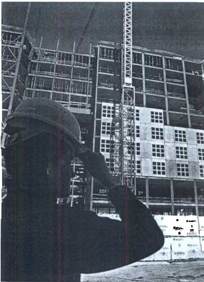
El sector constructivo asiste a un certamen grande, en superficie y contenidos. Al lado, edición de 2002