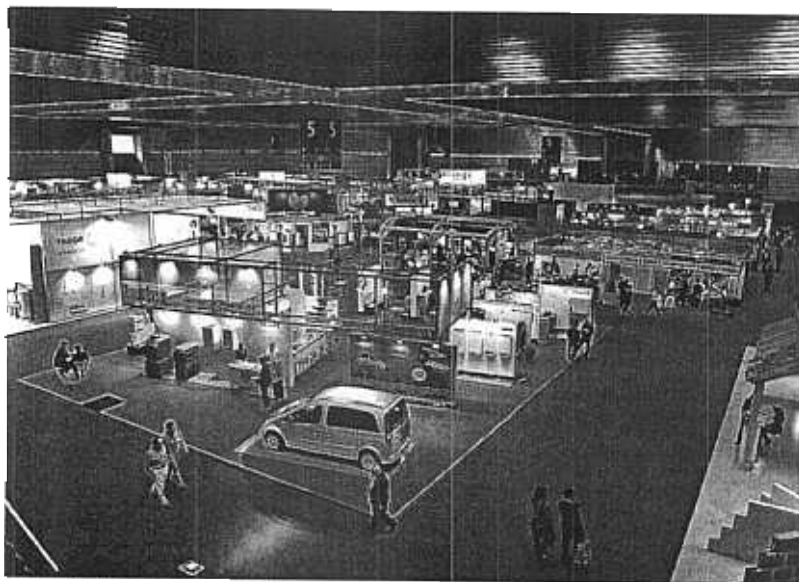
Los expositores de Construlan ocupan totalmente los pabellones 3 y 5 del BEC. Oskar Martínez

CONSTRUCCIÓN Esta feria ha experimentado un crecimiento del 81% en el número de participantes