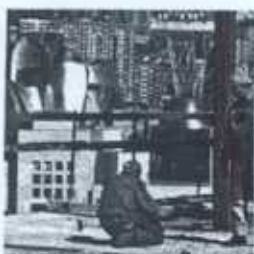
Unos obreros, en Abandoibarra

más del 50% de las inversiones públicas en construcción retorna al erario público, por aumento de las recaudaciones impositivas, cargas fiscales y menores prestaciones por desempleo. En Euskadi, en 2003 se registró un crecimiento acumulado del 4,2 respecto de 2002 en el valor de producción. Además del incremento