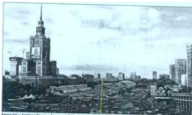
Ferrovial y Acciona llevan años consolidándose en el mercado polaco.

Acciona, por su parte, aún no olvida su deficitaria inversión en Elektrim, la matriz de Mostostal que sus-