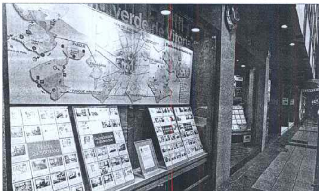
Establecimiento inmobiliario en una calle comercial de Vitoria.