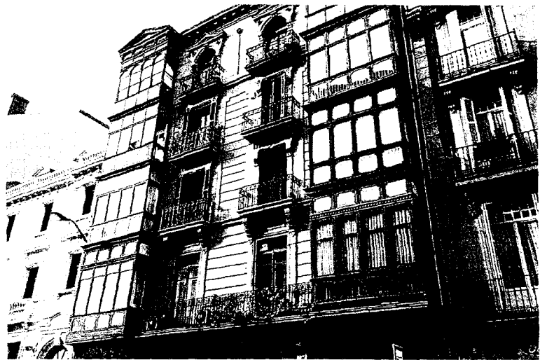
El Gobierno vasco invertirá 90.152 euros en la conservación y calidad de las edificaciones