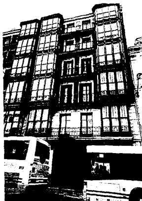
El ruido molesta a los vecinos