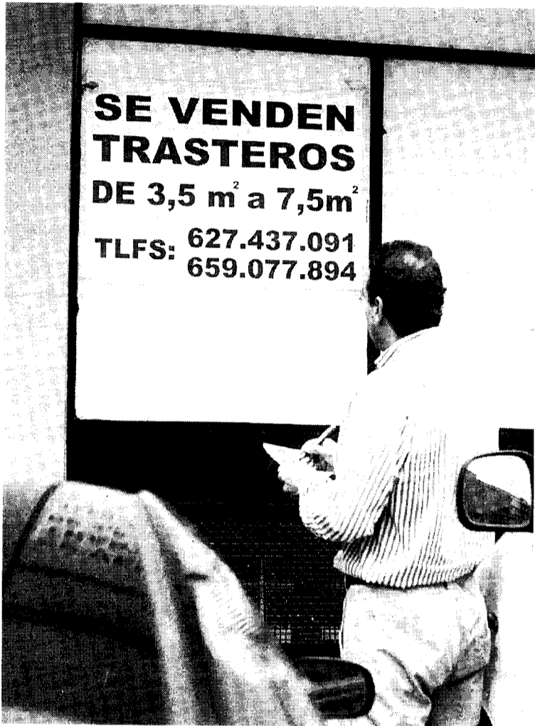
Un joven lee un cartel de venta de trasteros.

El creciente número de peticiones para habilitar trasteros en sótanos, plantas bajas y altillos ha obligado al Ayuntamiento de Bilbao a promover una modificación de la normativa municipal para regular la proliferación de camarotes en edificios y pabellones industriales. Este cambio del Plan de Ordenación Urbana supone reconocer el valor del trastero como pieza inmobiliaria propia, ya que hasta ahora se trataba de un habitáculo de uso secundario vinculado al edificio matriz.