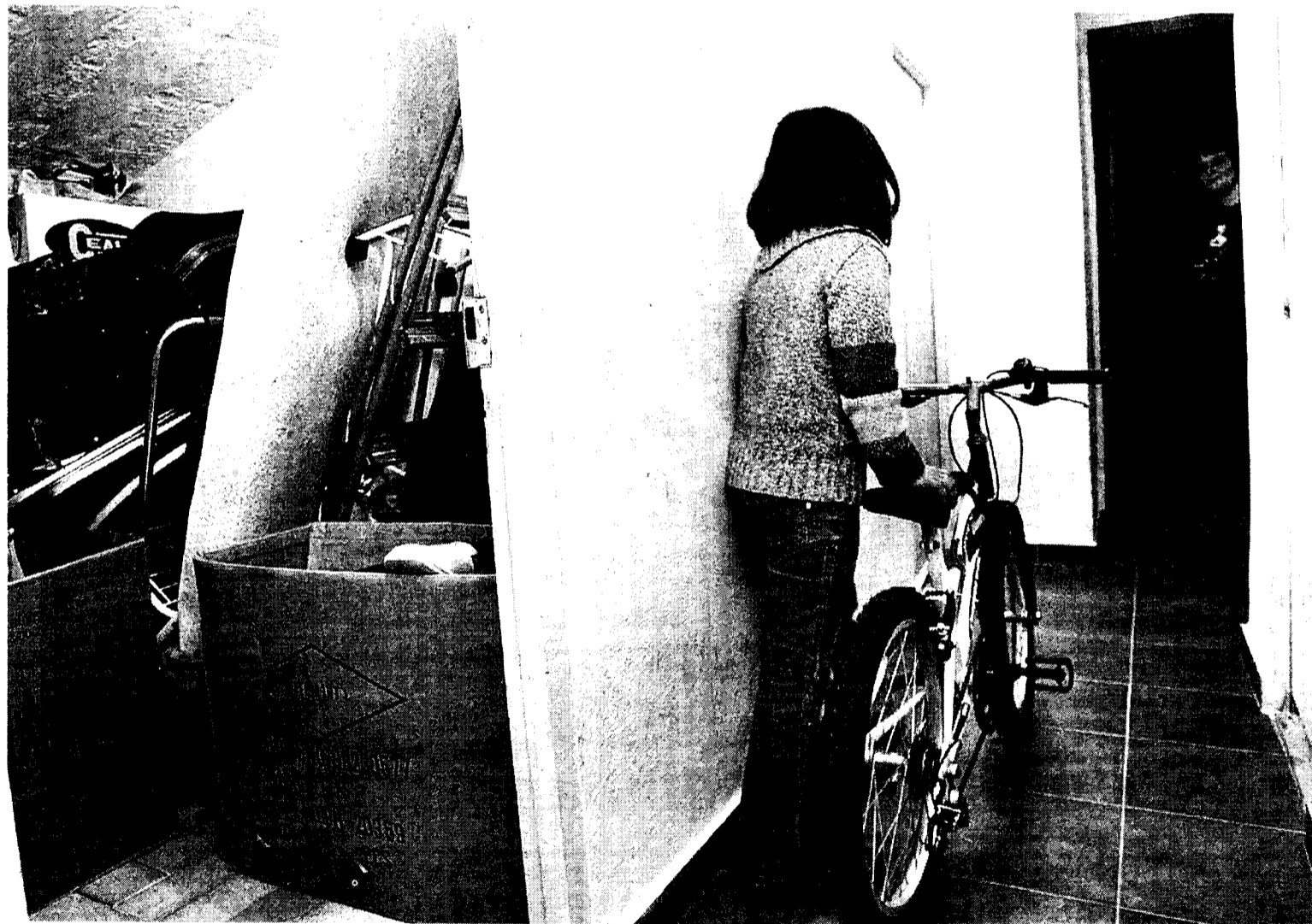
ALMACÉN. Los camarotes sirven para guardar todo tipo de objetos, desde una bicicleta hasta una escalera.

Los huecos, de seis metros cuadrados de superficie como mínimo, tienen tres metros de altura y disponen de entrada independiente y montacargas. El precio varía en función de su tamaño. Los más pequeños tienen cerca de seis metros cuadrados y cuestan 13.800 euros, mientras que los de mayor superficie –algo más de nueve metros– se venden por 22.000.