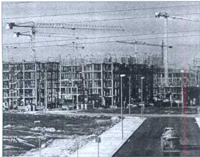
La adquisición de vivienda ha sido el principal factor de crecimiento del endeudamiento familiar. J. J. M. Martín

El incremento del endeudamiento está totalmente justificado por la evolución del crédito hipotecario —representa una media del 66% del total de préstamos concedidos por las entidades financieras en la zona del euro—. En España este tipo de