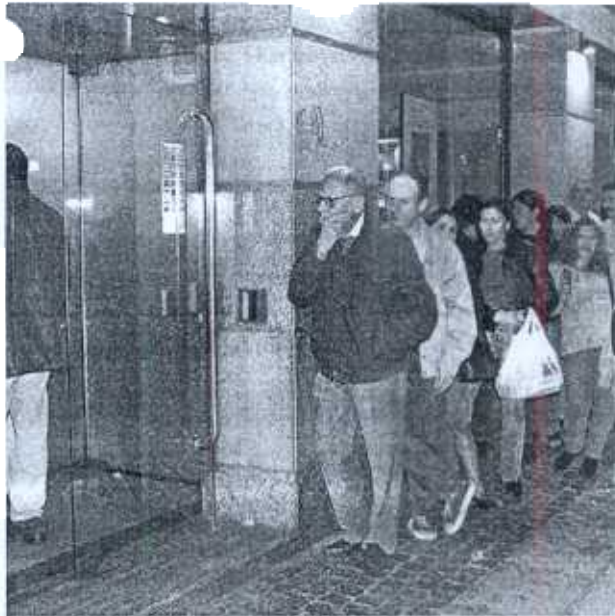
Varias personas hacen cola frente a un cajero automático para sacar dinero.

Inversión: Ha aumentado la diversificación geográfica de la cartera de activos y la inversión de las familias en el exterior supone un 12% del total, frente al 2% de hace 15 años.