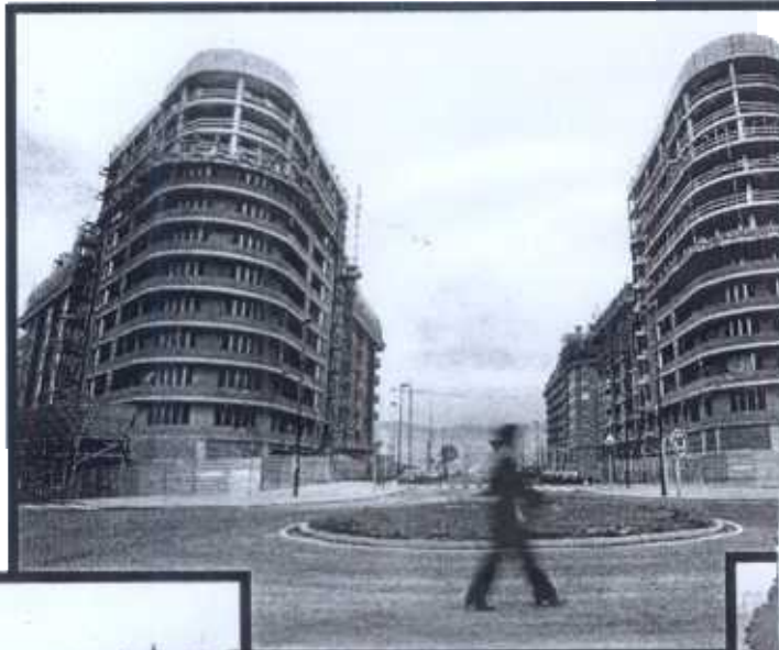
Viviendas en Miribilla, el nuevo Ensanche de la capital vizcaína.