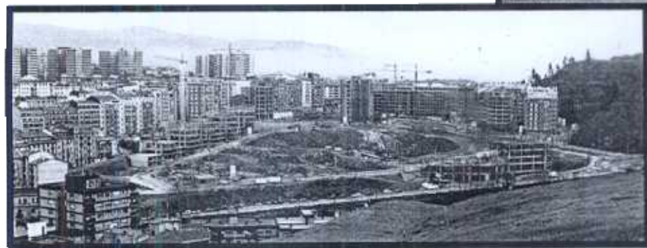
En el complejo urbanístico de Mina del Morro están previstas 1.151 nuevas viviendas.