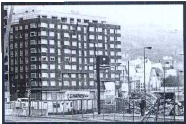
El complejo residencial de Abandoibarra tendrá 700 nuevas viviendas de lujo.