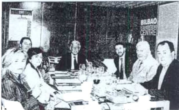
▲ Las obras del futuro recinto ferial se iniciaron en 2001 y culminarán en 2004, para acoger la Bienal de Máquina Herramienta.