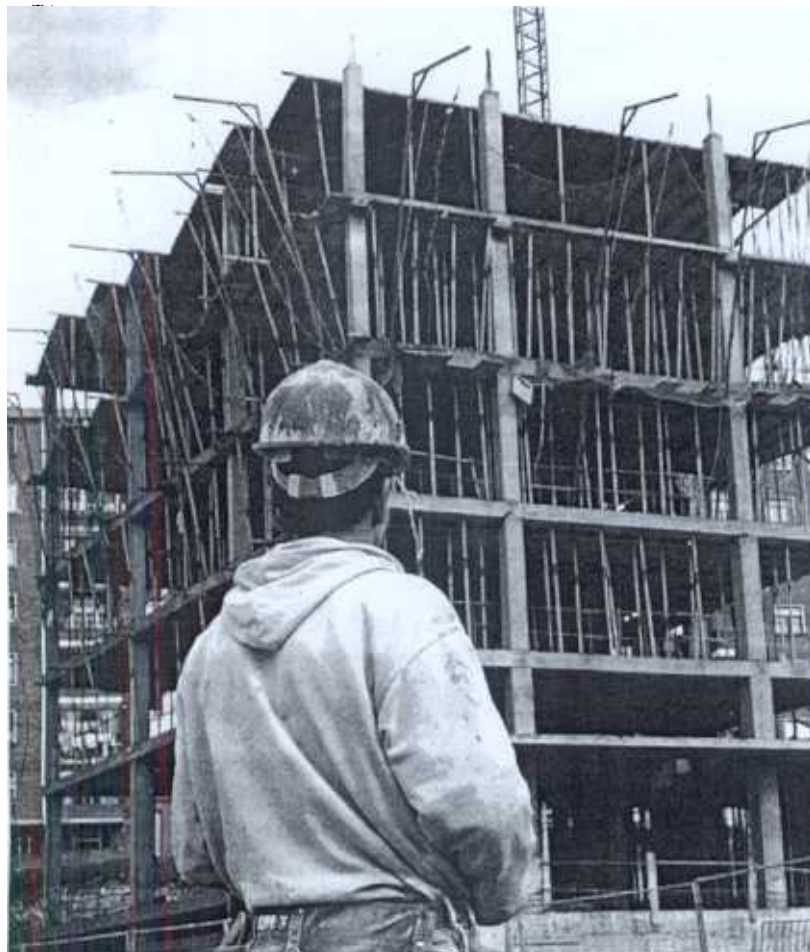
ESCALADA. Viviendas en construcción en el barrio bilbaíno de Mina del Morro.

Barcelona y Madrid vuelven a encabezar la clasificación seguidas de San Sebastián y Vitoria, mientras que los inmuebles más baratos están en Badajoz