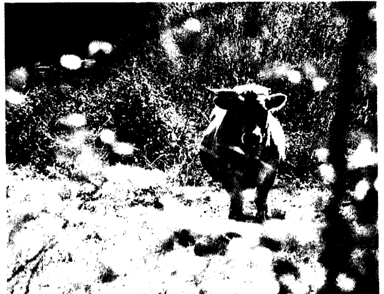
Una vaca asilvestrada en un pastizal natural.

Este servicio fue instaurado inicialmente para la retirada del ganado que no era sometido a los controles sanitarios obligatorios y que suponía un foco de enfermedades que podrían ser transmitidas a las explotaciones ganaderas. La problemática era especialmente grave en las comarcas limítrofes con otras comunidades autónomas, como es el caso de Las Encartaciones. Ya que este tipo de ganado ha sido eliminado casi en su totalidad, la recogida de reses se ha reducido notablemente.