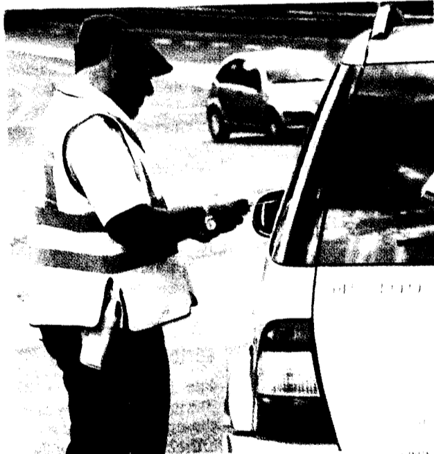
La Ertzaintza establecerá mañana un dispositivo especial en los accesos a Elantxobe.

Mañana Bizkaia vive una de las citas más importantes del verano. Elantxobe y Bermeo volverán a 'disputarse' la isla de Izaro dentro de los actos de celebración de 'las Madalenas'. Y como cada 22 de julio, las restricciones de tráfico y los controles de alcoholemia serán los protagonistas de esta jornada. Así la Ertzaintza bloqueará el paso a los no residentes de Elantxobe en los siguientes puntos: la BI-3234 en el cruce de Akorda, la BI-3237, en el cruce de Arriederra y la BI-3238 en el de Natxitua. La masiva afluencia de personas hace que el Departamento de Interior establezca un dispositivo de seguridad que, junto a Osakidetza, Salvamento Marítimo, DYA, SOS Deiak 112 y Cruz Roja, en un Puesto de Mando, garantizará que este día festivo transcurra con absoluta normalidad.