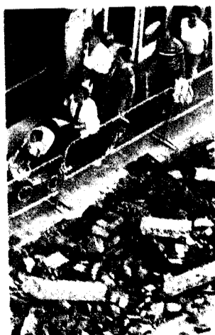
Obras en la calle Santutxu.

EuskoTren se 'suma' a las Madalenas en Bermeo a través de un servicio reforzado entre Bilbao y Bermeo en los últimos trenes de la tarde-noche de mañana. Por ello, en Atxuri, el tren de las 19.48 y las 20.48 horas llegará hasta Bermeo, en vez de finalizar en Gernika y habrá dos servicios especiales de Bermeo a Gernika con salidas a las 21.18 y 22.18 horas.