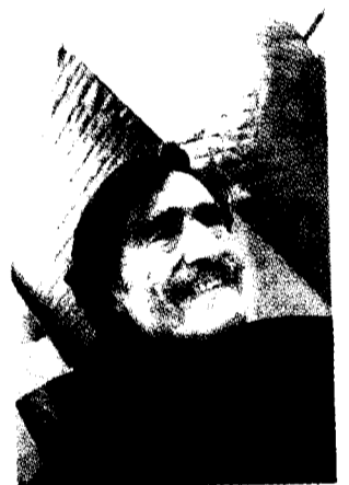
Miguel de la Quadra Salcedo.

La edición de 2005 de la Ruta Quetzal pasará por Euskadi, donde cerca de 400 participantes permanecerán hasta el 29 de julio. Entre las iniciativas en las que participarán se encuentran la asistencia al santuario de Arantzazu de la mano de Artzain Mundua y de la escuela Artzain Eskola. La vigésima edición está liderada por el aventurero Miguel de la Quadra Salcedo.