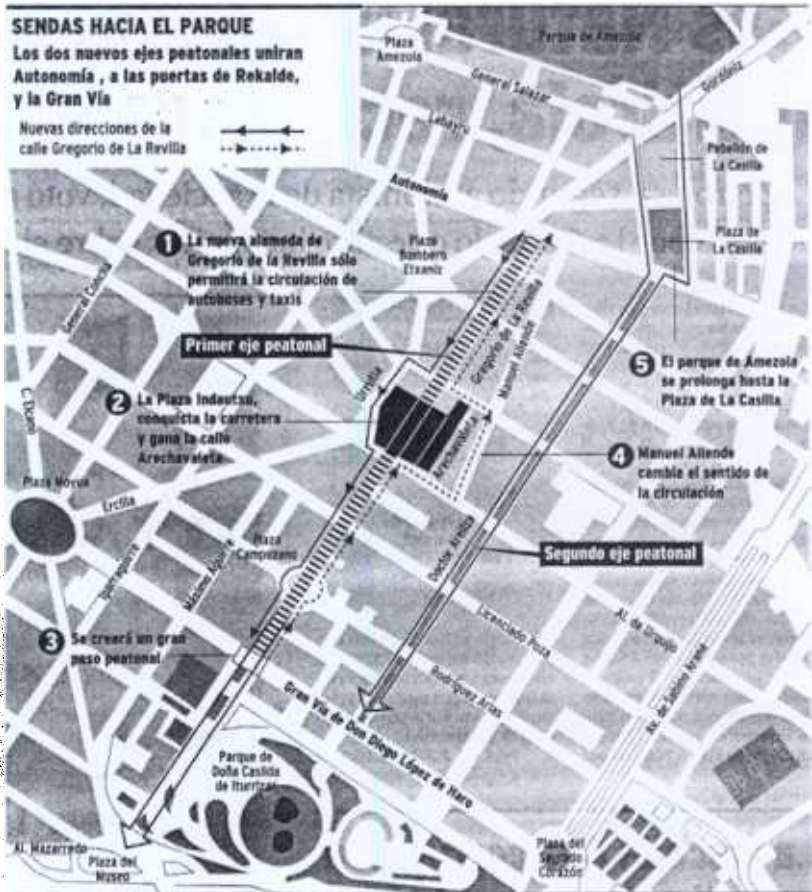
GRÁFICO: FERNANDO G. BAPTISTA

La Plaza Indautxu se convertirá en el punto de encuentro. La carretera, que atraviesa este recinto, desaparecerá en este punto, dando lugar a una rotonda íntegramente peatonal. El transporte público rodeará la plaza, lo que obligará a reordenar los flujos de tráfico en las calles del entorno. Un gran paso peatonal se dibujará en la Gran Vía para