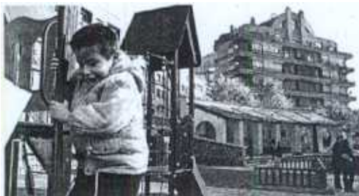
Un niño juega en un columpio de la plaza San Pedro.

Por otro lado, se estudia también la posibilidad de convertir la avenida Madariaga en un tramo peatonal similar a la calle Ercilla, con el fin de reforzar su actividad comercial y hostelera. Sin embargo, el Consistorio da por hecho que es «imposible» llevar adelante los dos proyectos por los problemas que se generarían al transporte público. Ambas propuestas han sido remitidas al consejo de distrito para su debate.