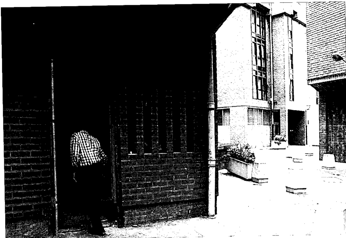
Un hombre entra en una lonja que se habilita en Getxo para su transformación en vivienda.

Galdakao, en cambio, es el único que descarta el recurso de las lonjas alegando las más de 400 VPO previstas en los próximos años en