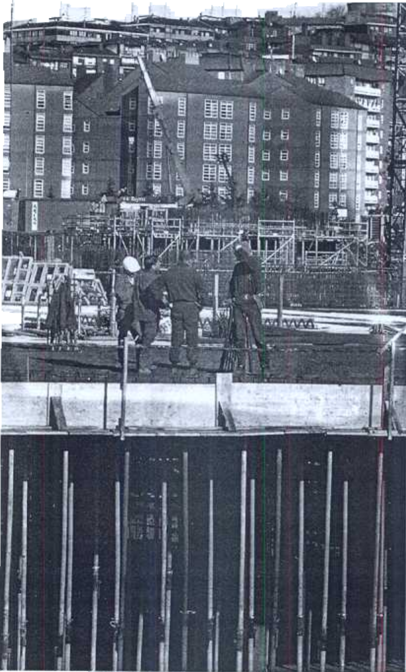
Con este programa se pretende contribuir a la sostenibilidad puesto que hay poco suelo para construir. Zigor Alkorta

Con este nuevo programa se pretende ofrecer alquileres a unos precios que resulten más asequibles frente a los caros que son en la actualidad.