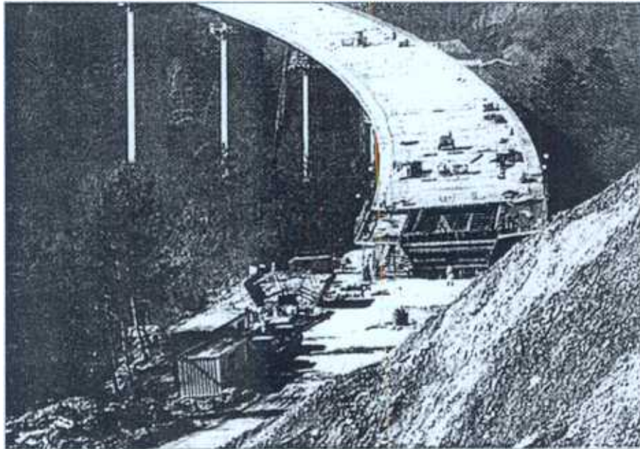
El Gobierno ha proyectado una inversión de 114.000 millones de euros en el Plan de Infraestructuras 2000-2007.

El efecto más inmediato ha sido la introducción de fuertes rebajas entre el precio inicial del contrato y la oferta final de los licitadores. Según el Ejecutivo, las bajas o descuentos para proyectos de obras y de ingeniería durante el último año -diferencia entre el presupuesto de licitación y la oferta de la empresa- se han situado "por encima del 10% y cerca del 20%", respectivamente. A pesar de los beneficios para la Administración,