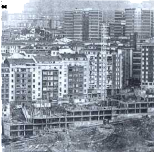
ABIGARRAMIENTO en Santutxu y Bolueta.

La Universidad, el aeropuerto y el Parque Tecnológico sirven de refe-