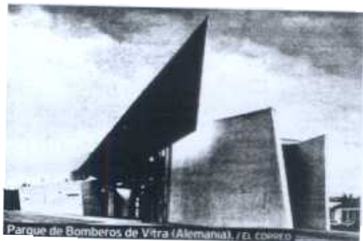
Parque de Bomberos de Vitra (Alemania).

rando durante muchísimo tiempo. Hacia años que Zaha Hadid —inmersa actualmente en el diseño del Guggenheim de Taichung, en Taiwan— no visitaba Bilbao. «Vine cuando la explanada del museo aún era una zona industrial. La transformación ha sido espectacular, pero lo que más me ha impresionado —apuntó— es la ambición de la ciudad, de sus autoridades, que han demostrado cómo es posible hacer cambios radicales en poco tiempo». La arquitecta reconoció, en este sentido, estar «sorprendida» por la «buena colaboración institucional». «Eso no es normal en Inglaterra», aseguró.