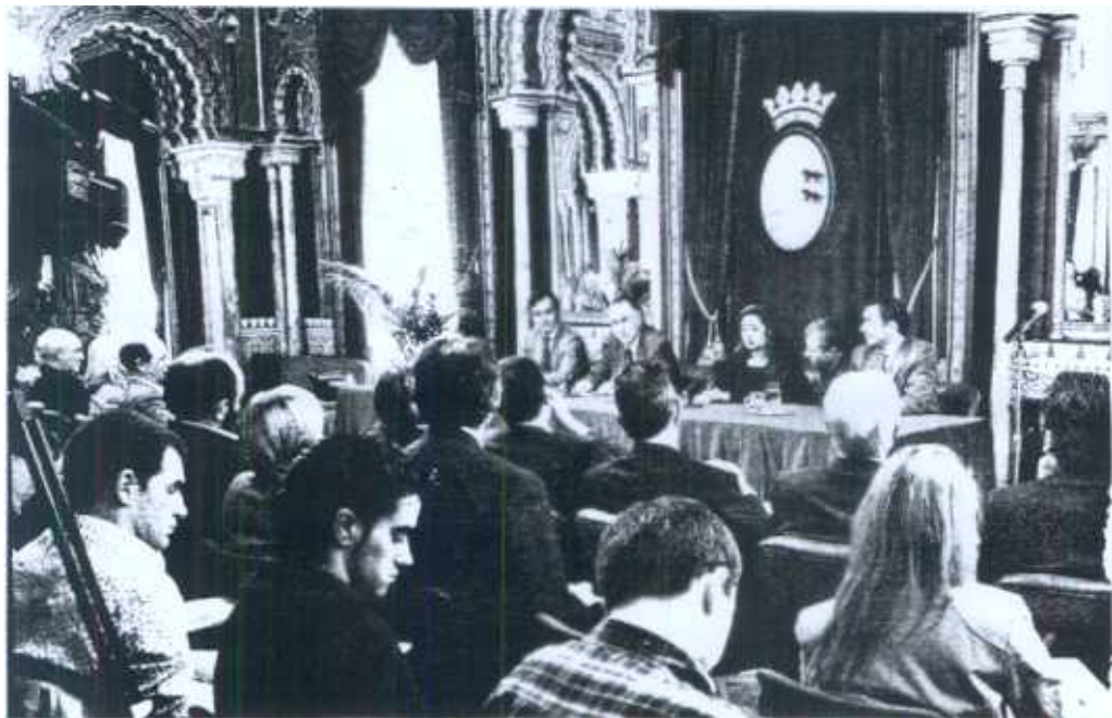
Un momento de la comparecencia ante los medios de comunicación de la arquitecta Zaha Hadid en el salón árabe del Ayuntamiento de Bilbao. Roberto Zarrabellia

LA VISITA La arquitecta Zaha Hadid visitó Bilbao en un viaje relámpago para conocer "in situ" la península de Zorrozaurre antes de iniciar su diseño.