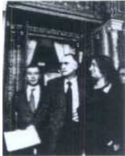
Azkuna, Corres y Hadid. Zarrabellia

«Deseamos que haga un "master plan" buenísimo, equilibrado entre viviendas y equipamiento y abrazado a la Ría, porque no quedan muchas oportunidades en la ciudad» le pidió el alcalde Iñaki Azkuna a Zaha Hadid. Consciente del reto que asume la arquitecta