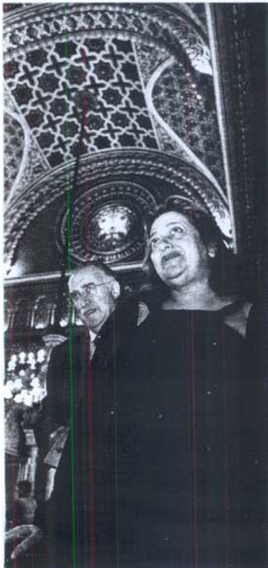
RAÍCES ÁRABES. Zaha Hadid, con el alcalde Azkuna.

Dotada de un rotundo físico, Zaha Hadid dejó entrever en su indumentaria rasgos de su identidad provocadora. Vestida completamente de negro, lucía un atrevido anillo horizontal que se apoyaba sobre tres dedos de su mano derecha y un curioso bolso, de color dorado, que recordaba las sinuosas curvas de un trasero.