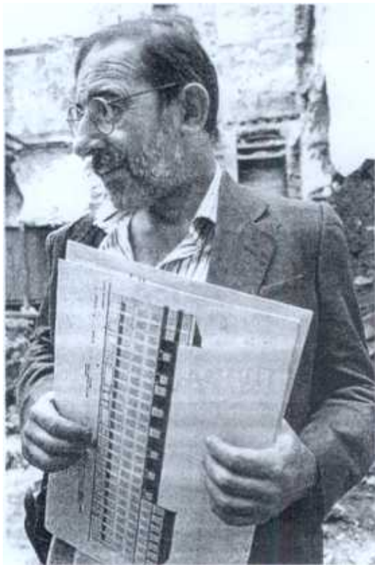
Siza trabaja la vivienda y los edificios emblemáticos.

Esta misma distinción ha recaído en urbanistas que ya han dejado su huella en Bilbao o lo harán