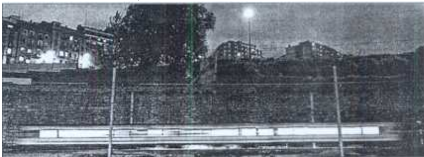
Las alternativas ferroviarias como el tren y el tranvía se quieren impulsar en los próximos años.

pios no apliquen precios sin control, por lo que ha calculado en 96.000 euros el precio máximo para las viviendas de protección oficial y entre 96.000 y 180.000 euros el precio máximo para las viviendas de precio tasado.