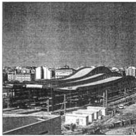
Obras de la estación de Renfe que Copcisa ha realizado en Lleida.

Otra de las compañías especializada en obra pública es Constructora Hispánica, ya que este negocio representa