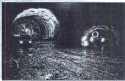
Túnel para el tren de alta velocidad en la sierra de Guadarrama.

El Grupo Ferrovial obtuvo en el primer semestre de este ejercicio un resultado neto de 137,3 millones de euros, un 58% menos que el pri-