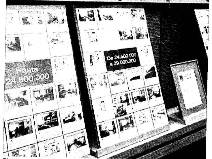
Pisos en venta en una agencia inmobiliaria de Vitoria.

sociales se situó en 715 euros, lo que supone un 10% más.