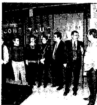
Imagen de archivo del IES. K.C.

El incremento de participación femenina en estos estudios relacionados con la familia de la construcción se debe, según Basagoiti, «a que la mujer se está introduciendo en todos los sectores laborales, políticos y de decisión de nuestra sociedad. Y para ello se está saltando sus propias