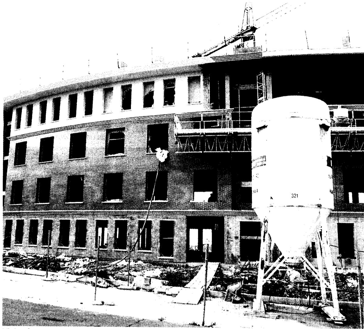
Viviendas en construcción en la Comunidad Autónoma Vasca