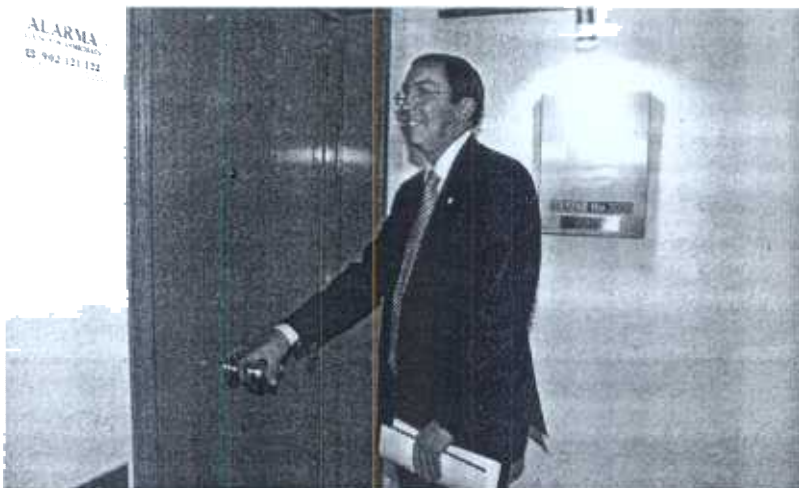
El diputado general a su entrada en la sede de Bilbao Ría 2000 donde ayer se reunió con el resto del comité ejecutivo. Z.Aikorta

En este sentido, aseguró que, ante los intereses que han demostrado «ya más de diez empresas privadas, se va a convocar un concurso internacional» para que pu-