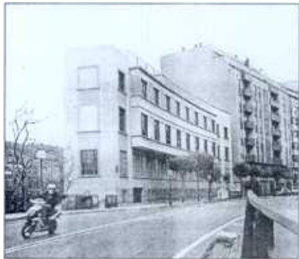
El antiguo edificio del Instituto Foral de Asistencia Social.

Sobre el IFAS, Azkuna comentó que Ría 2000 habrá de evaluar qué hacer en el mismo. «pero si en un momento dado a la Diputación le hiciera falta, nosotros desde el Ayuntamiento lo recalificaríamos de nuevo».