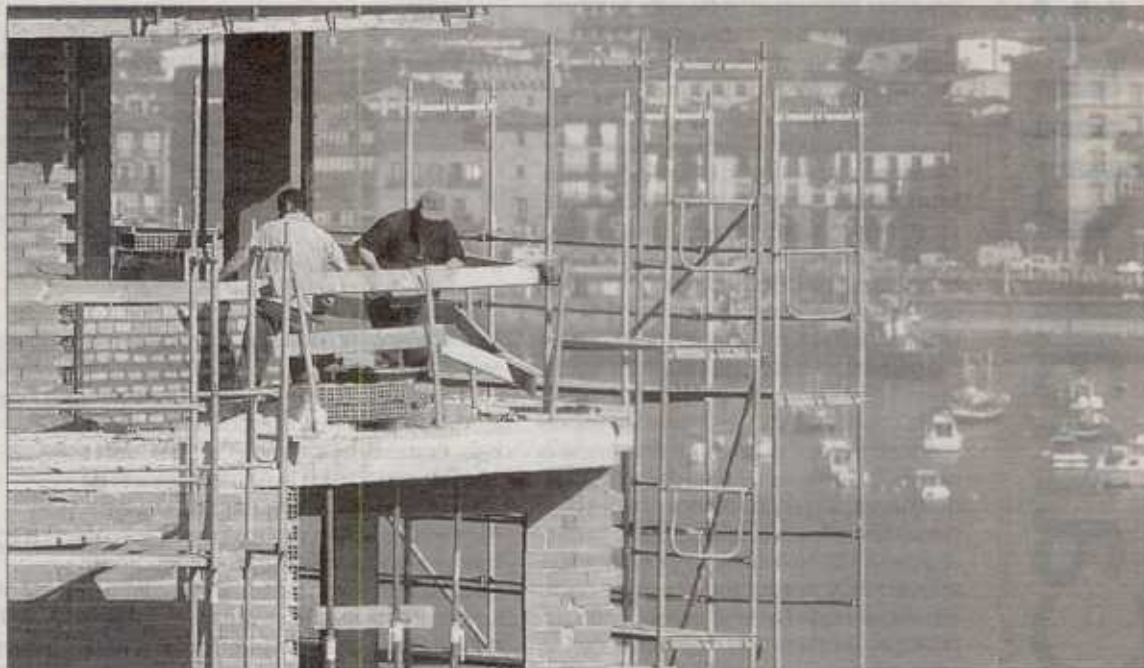
Algunos impuestos inmobiliarios han doblado su cuantía en el último año.

Así, el comprador de una vivienda valorada en 240.000 euros deberá destinar 36.000 al pago de tributos como el IVA y actos jurídicos. En concreto, la mayor parte de este coste impositivo en la adquisición de un piso se la lleva el IVA (hasta el 41,1% del total),