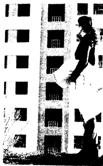
Una casa, la ilusión de los jóvenes.

El Consejo contrasta el coste medio de venta de una vivienda libre, situado en 269.700 euros (un 17% más que el año anterior y un 132,5% más que hace once años) con el precio máximo asumible por una persona joven, que cifran en 130.200 euros, esto es, que podría dedicarle 419 euros al mes.