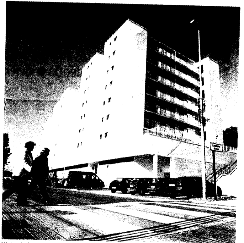
Vista de las viviendas sociales de Lamiako, en Leioa.

adelantó que, de llevarse a cabo la aprobación de la Ley de Suelo, se reservará el 70% del suelo urbanizable de los municipios con más de 3.000 habitantes para VPOs.