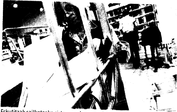
Eskutitzak sailkatzeko sistema azkarragoa izango da.

Etxebarrin Correosek eskutitzak sailkatzeko zentro bat zabaldu du eta dagoeneko funtzionamenduan dago. Modu horretan, instalakuntzei esker, automatikoki 700.000 eskutitza sailkatuko ditu eta urte amaierarako 360 milioi izango dira. Orain arte Bilboko Bailen kalean zegoen eraikina ordezkatzeko du. 3.500 metro karratu baino gehiago izango ditu.